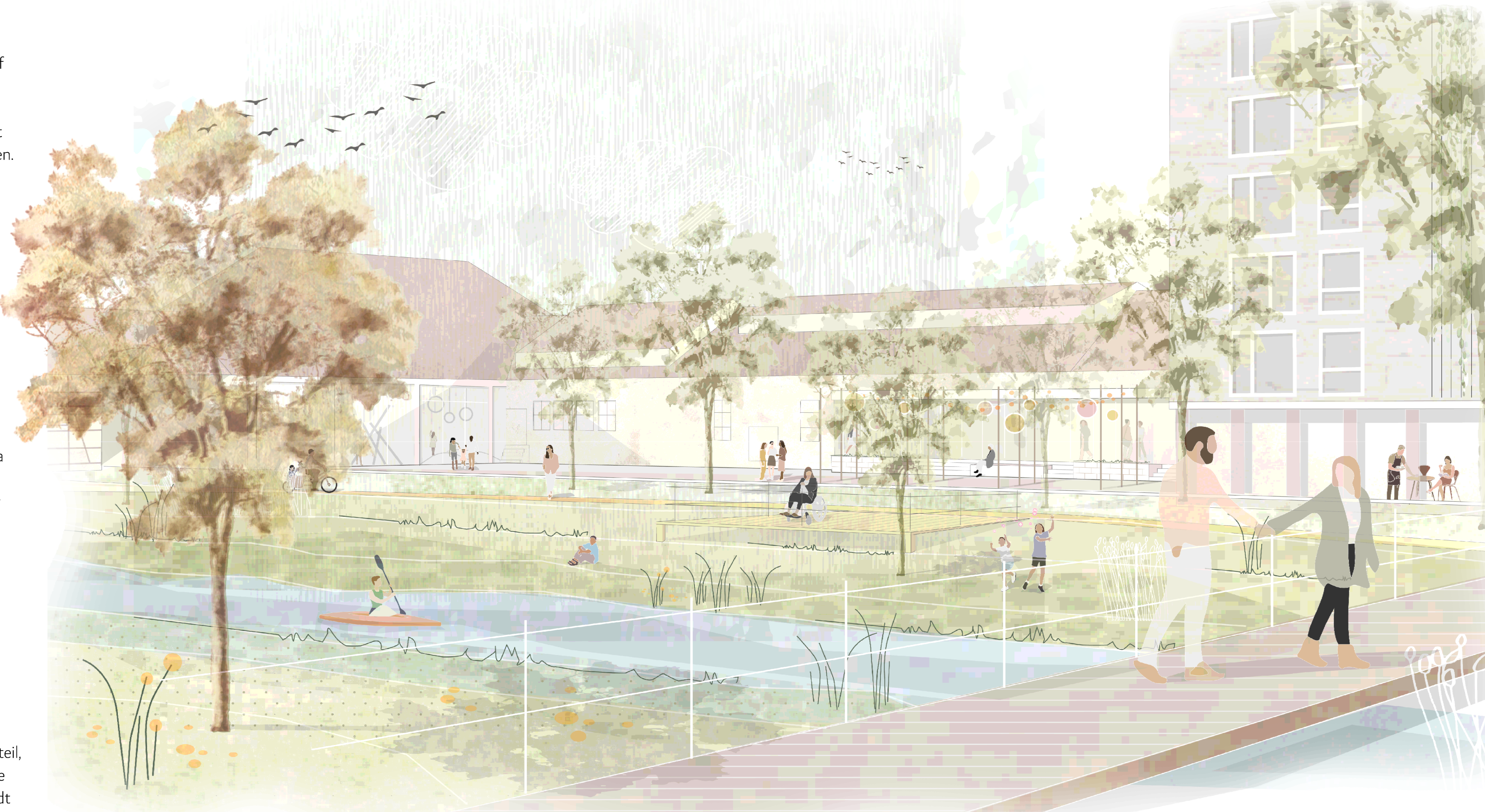
VISION STADTHALLENAREAL AN DER DONAU (2x DIN A4)

Im Gebiet der historischen Stadthalle und Viehmarkthalle entsteht ein neuer Stadtteil, der sich bewusst mit seiner historischen Bedeutung auseinandersetzt und damit die Identität der gesamten Umgebung stärkt. Ein Ort für alle Bewohner*innen der Stadt Riedlingen, für Besucher*innen; ein Ort, der einladet zum Schlendern, Flanieren, Verweilen, Treffen, Besuchen, Arbeiten, Spielen und vor allem zum Leben.