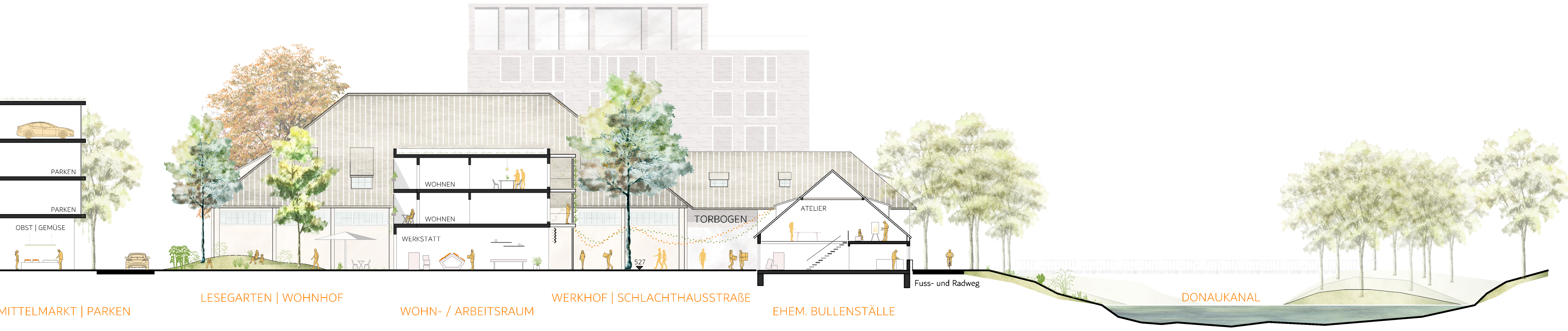
MITTELMARKT | PARKEN LESEGARTEN | WOHNHOF WOHN- / ARBEITSRAUM WERKHOF | SCHLACHTHAUSSTRASSE EHEM. BULLENSTÄLLE Fuss- und Radweg DONAUKANAL